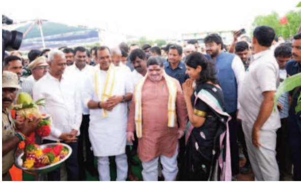
అయిందని చెప్పారు. వాహనాల ఫిట్నెస్, పోల్యూషన్ అన్నీ వాహన సారథిలో చూసుకోవచ్చని తెలిపారు. ఏబి డ్వారా డ్రైవింగ్ లైసెన్సెలు