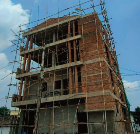
ఎల్లంపేట పురపాలక సంఘం పరిధిలోని శ్రీరంగవరం గ్రామంలో నిర్మిస్తున్న నిర్మాణం