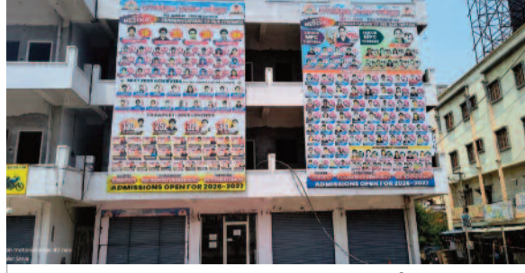
భవనం ముందు ఇతర ప్రాంతాలలో హూంబులు సాధించిన ర్యాంకుల పోస్టర్లు