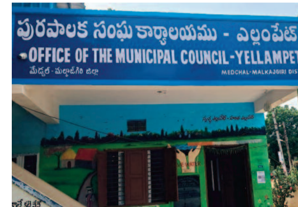
ప్రశ్నిస్తే 'లెటర్' డ్రామా.. బాధ్యతారాహిత్యానికి పరాకాష్ఠ !