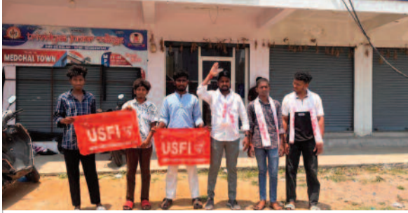
కళాశాలను సీజ్ చేయాలని భవనం ముందు ధర్మా చేస్తున్న యుఎస్ఎఫ్ఎస్ నాయకులు

మేడ్చల్, నేడు న్యూస్ : విద్యార్థుల భవిష్యత్తును తీర్చిదిద్దాలని విద్యాసంస్థలు నేడు లాభార్జన్ ధ్యేయంగా మారుతున్నాయి. మేడ్చల్ పరిధిలోని 'త్రివిద్య జూనియర్ కళాశాల' నిబంధనలను బేఖాతరు చేస్తూ, విద్యార్థుల ప్రాణాలతో చెలగాటమారుతోంది. కనీస అనుమతులు లేకున్నా, ఆకాశమే హద్దుగా ప్రచారం చేస్తూ అడ్మిషన్ల పేరిట తల్లిదండ్రులను బురిడీ కొట్టిస్తోంది.