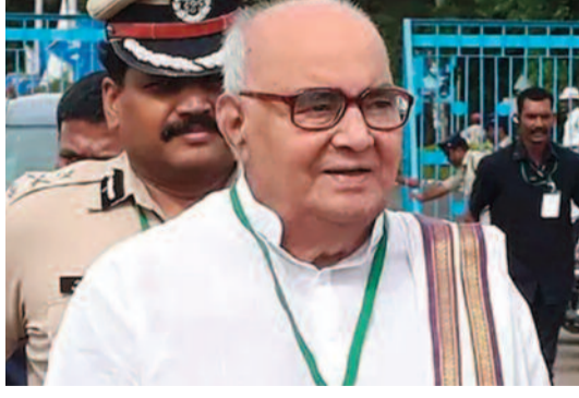
మార్గదర్శి నాదెండ్ల భాస్కర్ రావు. ప్రజా ప్రతినిధిగా భాస్కర్ రావు చేసిన సేవలు చిరస్మరణీయం. 1980వ దశకంలో తెలుగుదేశం పార్టీ ఆవిర్భావంలో ఆయన కీలక పాత్ర పోషించారు. స్వల్పకాలం ముఖ్యమంత్రిగా పనిచేసినప్పటికీ, అంతకుముందు మంత్రిగా ఆయనకు పరిపాలనపై గట్టి పట్టు ఉండేది. చట్టసభల పనితీరుపై ఆయనకు అపారమైన అవగాహన ఉంది. గుంటూరు జిల్లా నుంచి రాజకీయ ప్రస్థానం ప్రారంభించి, రాష్ట్ర జాతీయ స్థాయిలో తనదైన ముద్ర వేశారు అని మంత్రి కందుల దుర్గేశ్ అన్నారు. మంత్రి నాదెండ్ల మనోహర్ కుటుంబ సభ్యులకు ఆయన ప్రగాఢ సానుభూతి తెలియజేశారు. నాదెండ్ల భాస్కర్ రావు ఆత్మకు శాంతి చేశారాలని భగవంతుడిని ప్రార్థించారు.

మంత్రి కందుల దుర్గేశ్ తదితరుల సంతాపం హైదరాబాద్, ఏప్రిల్ 22: ఉమ్మడి ఆంధ్రప్రదేశ్ మాజీ ముఖ్యమంత్రి నాదెండ్ల భాస్కర్ రావు (90) కన్నుమూశారు. కొంతకాలంగా అనారోగ్యంతో బాధపడుతున్న భాస్కర్ రావు ప్రైవేట్ ఆస్పత్రిలో చికిత్స పొందుతూ మృతి చెందారు. 1935 జూన్ 23న గుంటూరులో జన్మించిన నాదెండ్ల భాస్కర్ రావు 1978లో విజయవాడ ఉన్న నుంచి పోటీ చేసి తొలిసారి ఎమ్మెల్యేగా ఎన్నికయ్యారు. 1978 నుంచి 1989 వరకు ఎమ్మెల్యేగా కొనసాగారు. 1986 ఆగస్ట్ 16 నుంచి సెప్టెంబర్ 16 వరకు ఉమ్మడి ఆంధ్రప్రదేశ్ సీఎంగా బాధ్యతలు నిర్వహించారు. అప్పటి ముఖ్యమంత్రి ఎన్టీఆర్ ను పదవీమ్యుతిడిని చేసిన నాదెండ్ల నెలరోజులపాటు సీఎంగా కొనసాగారు. నాదెండ్ల భాస్కర్ రావు మృతిపట్ల సీసీ, రాజకీయ ప్రముఖులు దిగ్భ్రాంతి వ్యక్తం చేశారు. నాదెండ్ల భాస్కర్ రావు ఆత్మకు శాంతి చేసుకొంటూ ప్రాణిస్తూ సంతాపం తెలియజేశారు. నాదెండ్ల భాస్కర్ రావు కుమారుడు నాదెండ్ల మనోహర్ ప్రస్తుతం జనసేన పార్టీ తరఫున ఏపీ మంత్రిగా సేవలందిస్తున్నారని తెలిపింది. ఉమ్మడి ఆంధ్రప్రదేశ్ మాజీ సీఎం నాదెండ్ల భాస్కర్ రావు (90) కన్నుమూశారు. గత నెల రోజులుగా నాదెండ్ల భాస్కర్ రావు మృతి పట్ల మంత్రి కందుల దుర్గేశ్ తీవ్ర దిగ్భ్రాంతి వ్యక్తం చేశారు. భాస్కర్ రావు మృతి రాజకీయ రంగానికి తీరని లోటు. ఎంతోమంది నేతలకు రాజకీయ ఓనమాలు నేర్పిన గొప్ప