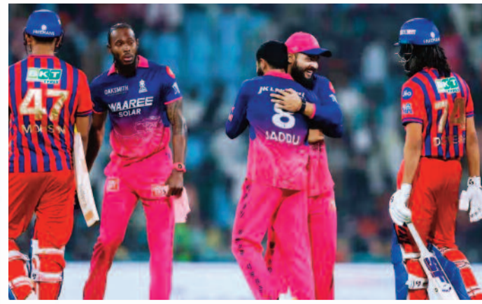
లభనపూపై రాజస్థాన్ రాయల్స్ ఘన విజయం