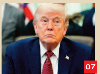
కాల్పుల విరమణ పాడిగించిన ట్రంప్