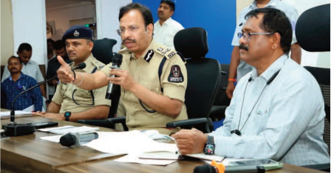
అకౌంట్లపై నిరంతర పర్యవేక్షణ కోసం ఆర్బిఐ, బ్యాంకులు, పోలీసులతో కూడిన జాయింట్ పర్మిట్ గ్రూప్ ఏర్పాటు చేయాలని ప్రతిపాదించారు. ప్రజలు అప్రమత్తంగా ఉండాలని విజ్ఞప్తి చేశారు. వాట్సాప్, టెలిగ్రామ్ వంటి వేదికల్లో వచ్చే అధిక లాభాల ప్రకటనలను నమ్మవద్దని, 'డిజిటల్ అరెస్ట్' పేరిట వచ్చే బెదిరింపులకు భయపడవద్దని సూచించారు. సైబర్ మోసానికి గురైతే 'గోడలెన్ అవర్'లో 1930 నంబర్కు కాల్ చేయాలని లేదా అధికారిక వెబ్సైట్లో ఫిర్యాదు చేయాలని సీపీ సూచించారు.