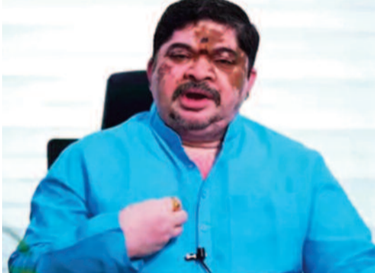
అంతర్వేదిక, నాయకత్వ అంశాలు ఉన్నాయని పేర్కొన్నారు. ఆర్టీసీ ఇప్పుడిప్పుడే కోలుకుంటుంది.. అన్ని అంశాలను పరిష్కరిస్తామని చెప్పారు. మిమ్మల్ని ఎవరూ అడ్డకోరని.. ప్రజల స్వాస్థ్య పర్యవేక్షణ మీ నాయకులు నిరసన తెలపవచ్చు.. ప్రజలపై ఒత్తిడి తీసుకురావచ్చని అన్నారు. అయితే పేద ప్రజల ప్రయాణాలకు ఇబ్బంది కలగజేయవద్దని విజ్ఞప్తి చేశారు. మీ నాయకులు నిరసన తెలపవచ్చు.. మిగతా వారంతా విధుల్లో చేరి ప్రయాణికులకు ఇబ్బంది లేకుండా చేయాలని కోరారు.

హైదరాబాద్, ఏప్రిల్ 22: ఆర్టీసీ సమ్మెను విరమించాలని రాష్ట్ర రవాణా శాఖ మంత్రి పొన్నం ప్రభాకర్ విజ్ఞప్తి చేశారు. సమస్యలకు సమ్మె పరిష్కారం కాదని ఆయన సూచించారు. సమస్యల పరిష్కారానికి నలుగురు అధికారులతో కమిటీ ఏర్పాటు చేసింది.. 4 వారాల్లో నివేదిక ఇవ్వాలని ఆదేశించామని తెలిపారు. కమిటీల పేరుతో కాలయాపన చేసేమనడం పొరపాటు అని స్పష్టం చేశారు. ఆర్టీసీ కార్మికులు లేవనెత్తిన 32 అంశాల్లో 29 అంశాలకు ప్రభుత్వం నుంచి ఎటువంటి వ్యతిరేకత లేదని పొన్నం ప్రభాకర్ తెలిపారు. అవన్నీ వెంటనే పరిష్కారమయ్యే అంశాలని పేర్కొన్నారు. ఆర్టీసీ విలీనం, గుర్తింపు సంఘాల ఎన్నికలు రెండు మెంబర్లతో ఉన్నాయని అన్నారు. ఈ రెండు అంశాల్లో పలు సాంకేతిక అంశాలు చరించాల్సి ఉందన్నారు. వీటిపై అధ్యయనం చేసేందుకే నాలుగు వారాల గడువు అడిగామని వివరించారు. ఈ రెండు అంశాలు కూడా సీఎం, డిప్యూటీ సీఎం దగ్గర చర్చి స్థాపన అన్నారు. ఆర్టీసీ విలీనం ఆలస్యమైనప్పటికీ, ఉద్యోగులకు ఒకటో తారీఖు జీతాలు వసూలు అవుతున్న ప్రభాకర్ తెలిపారు. గుర్తింపు సంఘాల ఎన్నికల విషయంలో నాయకుల మధ్య