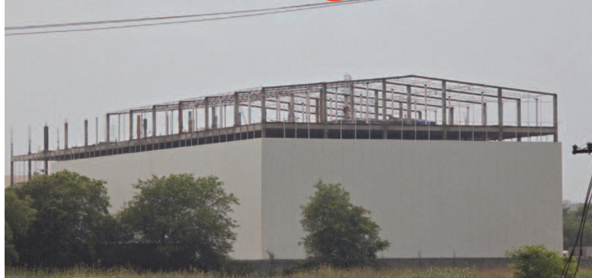
ఎల్లంపేట పురపాలక సంఘం పరిధిలో అనుమతులు లేని అరుణ గోదాం నిర్మాణం

మేడ్చల్, నేడు న్యూస్ : అధికార పార్టీ అండ ఉంటే చాలు.. చట్టాలు మట్టలుగా మారిపోతాయి, నిబంధనలు తుంగలో తొక్కబడతాయి అనడానికి ఎల్లంపేట మున్సిపాలిటీ పరిధిలో వెలుస్తున్న 'అరుణ గోదాం' ఒక సజీవ సాక్ష్యంగా నిలుస్తోంది. ఎటువంటి అనుమతులు లేకుండా, నిబంధనలకు విరుద్ధంగా రెండేళ్లుగా ఇక్కడ నిర్మాణం సాగుతున్నా.. సంబంధిత అధికారులు కస్తాల్లి చూడకపోవడం వెనుక భారీ రాజకీయ ఒత్తిడి ఉన్నట్లు ఆరోపణలు వెల్లవెత్తుతున్నాయి.