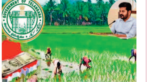
2025-26 ఖరీఫ్ సీజన్లో సుమారు 69.39 లక్షల మంది రైతులకు ఎకరానికి రూ. 6,000 వౌచరాలను మొత్తం రూ. 8,744.13 కోట్లను కేటాల తొమ్మిది రోజుల వ్యవధిలోనే పంపిణీ చేసి ప్రభుత్వం రికార్డు సృష్టించింది. రైతు భరోసా అబ్జెక్టివ్ సంగ్రహం సర్కారులో జిల్లా 5.22 లక్షల మందితో అగ్రస్థానంలో నిలిచింది. ఆ తర్వాతి స్థానాల్లో నాగార్జున (3.53 లక్షలు), ఖమ్మం (3.35 లక్షలు), సిద్దిపేట (3.18 లక్షలు) జిల్లాలు ఉన్నాయి.

హైదరాబాద్, ఏప్రిల్ 1 : తెలంగాణ రాష్ట్రంలోని కొత్త పట్టణాల్లో పాస్ పుస్తకాలు పొందిన రైతులకు రేపంతో సర్కారే భారీ ఊరటనిచ్చింది. ఇప్పటివరకు పాత లబ్ధిదారులకే పరిమితమైన రైతు భరోసా పథకాన్ని, కొత్తగా భూములు కొనుగోలు చేసే పట్టణ పొందిన రైతులకు కూడా వర్తింపజేయాలని ప్రభుత్వం నిర్ణయించింది. రాష్ట్రవ్యాప్తంగా కొత్తగా పట్టణ పొందిన సుమారు 85 వేల మంది రైతులు ఉన్నారని అంచనా వేయగా, వారిలో ఇప్పటికే 62 వేల మంది దరఖాస్తు చేసుకున్నారు. ఈ దరఖాస్తులను వ్యవసాయ శాఖ ప్రస్తుతం క్షుణ్ణంగా పరిశీలిస్తోంది. రైతుల అర్హత, భూమి వివరాలు, పట్టణాధారు నిజానిజాలను నిర్ధారించిన తర్వాత వారం, పది రోజుల్లో తుది జాబితాను సిద్ధం చేయనున్నారు. అర్హులుగా తేలిన కొత్త రైతులకు ఏప్రిల్ 15 నుంచి 20వ తేదీల మధ్య యాసంగి రెంట్ విడత రైతు భరోసా నిధులను నేరుగా సారి బ్యాంకు ఖాతాల్లో జమ చేయనున్నారు. ఈ సీజన్లో సుమారు 9.00 కోట్లను రైతుల ఖాతాల్లో జమ చేయాలని ప్రభుత్వం లక్ష్యంగా పెట్టుకుంది. రేపే వానాకాలం సీజన్లో లబ్ధి పొందిన ప్రతి రైతుకు, ఈ యాసంగిలో కూడా ఎటువంటి కోతలు లేకుండా పూర్తిస్థాయి పెట్టుబడి సాయం అందనుంది.