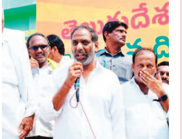
మార్ పేర్కొన్నారు. ఇదిలావుంటే పెండింగ్లో ఉన్న వ్యవసాయ విద్యుత్ కనెక్షన్లను సీజన్ ప్రారంభమయ్యే నాటికి మంజూరు చేయాలని మంత్రి గొట్టిపాటి రవికుమార్ అధికారులను ఆదేశించారు. విద్యుత్ అంతరాయాల లేకుండా అవసరమైన అన్ని చర్యలు చేపట్టినట్లు చెప్పారు. ఆర్ఎస్ఎస్, పీఎం సూర్యభద్ర, వ్యవసాయ విద్యుత్ కనెక్షన్లు, లోవోల్టేజీ సమస్యలపై సీపీడీసీఎల్, సెడ్ క్యాంప్ అధికారులతో సమావేశం. గ్రామీణ ప్రాంతాల్లో లోవోల్టేజీ సమస్య పరిష్కారానికి చర్యలు తీసుకోవాలి. కొనుగోలు వ్యయం తగ్గించుకోవడానికి పునర్యూజ్ చేయడం వినియోగం పెంచుకోవాలి. నియోజకవర్గానికి ఒక నమూనా సోలార్ గ్రామాన్ని అభివృద్ధి చేయాలి. విద్యుత్ వినియోగదారుల సంక్షేమస్థాయిని 90 శాతానికి పెంచాలని ఆదేశించారు. సౌర విద్యుత్ వినియోగాన్ని విస్తృతం చేసే దిశగా.. పీఎం సూర్యభద్ర కనెక్షన్లు మంజూరు చేయాలని రవికుమార్ అన్నారు. 'ఎస్సీ, ఎస్టీ కుటుంబాలకు ఉచిత సౌర విద్యుత్ కనెక్షన్' పాటు వేసేవి ముగిసే నాటికి ప్రతి నియోజకవర్గంలో 6 వేల సూర్యభద్ర కనెక్షన్లు ఇవ్వాలి. ఆర్ఎస్ఎస్-ఎస్ పనులను త్వరితగతిన పూర్తిచేయాలి. సీపీడీసీఎల్ పరిధిలో పెండింగ్లో ఉన్న 11 వేల వ్యవసాయ విద్యుత్ కనెక్షన్లను తక్షణం ఇవ్వాలి. వినియోగదారుల అనుమతితో స్మార్ట్ మీటర్లు ఏర్పాటు చేయాలని మంత్రి ఆదేశించారు.

అమరావతి, ఏప్రిల్ 1 : ఇచ్చిన హామీ మేరకు చేనేత మగ్గలకు నెలకు 200 యూనిట్లు, మరమగ్గలకు నెలకు 500 యూనిట్ల వరకు ఉచిత విద్యుత్ ఇవ్వాలని ప్రభుత్వం నిర్ణయించింది విద్యుత్ శాఖ మంత్రి గొట్టిపాటి రవికుమార్ అన్నారు. ఈ పథకం ద్వారా ఏటా ప్రభుత్వం రూ. 150కోట్లు వైసే భరిస్తోందని మంత్రి వెల్లడించారు. ఇచ్చిన హామీలు ఒక్కొక్కటిగా నెరవేర్చుతూ జగన్ నాశనం చేసిన విద్యుత్ వ్యవస్థను ముఖ్యమంత్రి చంద్రబాబు తన అపార అనుభవంతో గాడిలో ముడుచుకున్న మంత్రి అన్నారు. 22 నెలలుగా విద్యుత్ ఛార్జీలు పెంచుకుంటూ బ్రూడోన్ చేసిన ఘనత కూటమి ప్రభుత్వానిది అని చెప్పుకోవచ్చు. యువగళన పాద యాత్రలో చేనేతలకు నారా లోకేష్ ఇచ్చిన హామీ నేటి నుంచి అమల్లోకి రానుందని మంత్రి గొట్టిపాటి రవికుమార్ అన్నారు. బుధవారం మీడియాతో మాట్లాడుతూ.. అనంతపురం జిల్లా ధర్మవరం నియోజకవర్గంలో పాదయాత్ర సందర్భంగా చేనేతలు పడుతున్న కష్టాలను చూసిన లోకేష్ వారికి ఇచ్చిన హామీని నష్టాలను సరిదిద్దుతూనే రైతులు, చేనేతలు, ఆశ్వా, నల్లూరిలకు సబ్సిడీలు ఇస్తున్నామని అన్నారు. వినుకూటి ఆలోచనలతో సోలార్, విండ్, పవన్ డ్రైవ్, బ్యాటరీ స్టోరేజీ, గ్రీన్ హైడ్రోజెన్ విధానాలతో విద్యుత్ కొనుగోళ్ల భారాన్ని తగ్గించుకుంటున్నామని తెలిపారు. బయట నుంచి విద్యుత్ కొనుగోళ్ల తగ్గించి.. చరిత్రలో లేని విధంగా రికార్డు స్థాయిలో విద్యుత్ ఉత్పత్తి పెంచామని మంత్రి రవికుమార్ తెలిపారు. ఓల్డేజీ సమస్యలు పరిష్కరించేందుకు పెద్దపత్తున సబ్ సైడ్స్ నిర్మాణం చేపడుతున్నామన్నారు. చంద్రబాబుకు అప్పారావు అనుభవంతో విద్యుత్ సంస్కరణలు ఇంతటితో ఆగేవి కాదని.. రానున్న రోజుల్లో ప్రజలకు మరింత వెలుగుబాటు కల్పించేలా మార్పులు తీసుకొస్తామని మంత్రి గొట్టిపాటి రవికు