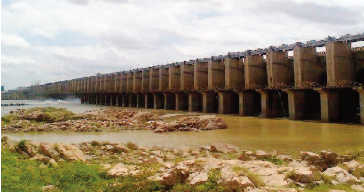
సంబంధించిన పరిమిత కాకుండా, ఈ సమస్య పరిష్కార కోసం పాలమూరు జిల్లాకు చెందిన మంత్రులు, ఎమ్మెల్యేల బృందం మరో వారం రోజుల్లో బెంగళూరు వెళ్లి కర్ణాటక ముఖ్యమంత్రి