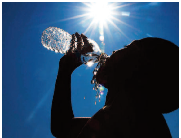
మూడు, నాలుగు రోజులు, మే, జూన్ నెలల్లో పది, అంతకంటే ఎక్కువ రోజులు వడగాడ్లు వీస్తాయి. రాత్రి వాతావరణం

హైదరాబాద్, ఏప్రిల్ 1 : రాష్ట్రంలో ఈ వేసవి సీజన్ మొత్తం ఎండ మంట వుట్టించనుంది. ఏప్రిల్ నుంచి జూన్ వరకు పగటి ఉష్ణోగ్రతలు సగటు కంటే ఎక్కువగా నమోదుకానున్నాయని వాతావరణ శాఖ హెచ్చరించింది. రానున్న మూడు నెలలకు దేశంలో వాతావరణ పరిస్థితులు, ఎండలు, వడగాడ్లు, వర్షాలపై భారత వాతావరణ శాఖ(ఐఎంఓ) బులెటిన్ విడుదల చేసింది. వచ్చే మూడు నెలలు రాష్ట్రం నిష్పల కాలిమిలా మారే అవకాశం ఉంది. ఏప్రిల్-మే, జూన్, అక్టోబర్, నవంబర్, డిసెంబర్, జనవరి, ఫిబ్రవరి, మార్చి, ఈశాన్య రాష్ట్రాల్లో పగటి ఉష్ణోగ్రతలు అధికంగా నమోదుకానున్నాయి. దేశంలోని మిగిలిన ప్రాంతాల్లో పగటి ఉష్ణోగ్రతలు సాధారణం లేదా అంతకంటే తక్కువగా నమోదవుతాయి. ఈ మూడు నెలల్లో ఎక్కువ రోజులు వడగాడ్లు వీరునున్నాయి. ఏప్రిల్లో సగటున