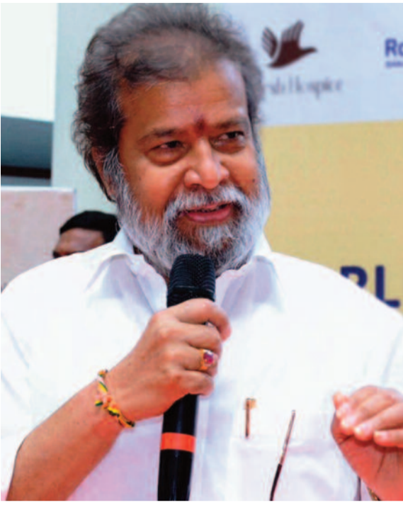
రోజునే నియామక పత్రాలు అందించడం ఎంతో సంతోషంగా ఉంది. ఈరోజు మాకు జీవితాంతం గురిచేసిపోతుంది. నల్గొంగ్ అనేది కేవలం ఒక వృత్తి కాదు.. మానవత్వానికి చేసే గొప్ప అవకాశం.