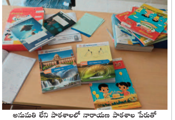
అనుమతి లేని పాఠశాలలో నారాయణ పాఠశాల పేరుతో అమ్మకానికి సిద్ధంగా ఉన్న పుస్తకాలు

మేడ్చల్, నేడు న్యూస్ : విద్యా బుద్ధులు నేరూల్లిన విద్యా సంస్థలే నిబంధనలను తుంగలో తొక్కతున్నారు. విద్యా సంవత్సరం ప్రారంభం కాకముందే ప్రైవేట్ విద్యాసంస్థల ఆగడాలు మిన్నంటుతున్నాయి. మేడ్చల్ సర్కిల్ పరిధిలోని అత్యల్పి గ్రామంలో వెలుస్తున్న నారాయణ ప్రైవేట్ స్కూల్ వ్యవహారం ఇప్పుడు చర్చనీయాంశంగా మారింది. కనీస అనుమతులు లేవు, భవనం పూర్తి కాలేదు.. కానీ అప్పుడే వేలల్లో, లక్షల్లో ఫీజులు వసూలు చేస్తూ అడ్మిషన్ల దండాకు తెరలేపడంపై స్థానికులు మండిపడుతున్నారు.