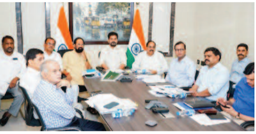
అవసరమైన టార్గెట్లను రైతులకు అందుబాటులో ఉంచాలన్నారు. అకాల వర్షాల సమయంలో సస్పం జరగకుండా శాశ్వత పరిష్కారానికి ప్రణాళికలు సిద్ధం చేసుకోవాలని కలెక్టర్లకు సూచించారు. వాతావరణ శాఖ సూచనల ఆధారంగా ఎప్పుడికప్పుడు రైతులను అప్రమత్తం చేసేందుకు మండల స్థాయిలో ఒక ప్రత్యేక అధికారిని నియమించాలని సీఎం ఆదేశించారు. వాతావరణ సూచనలను రైతులకు చేరవేసేందుకు ఒక ప్రత్యేక వ్యవస్థను ఏర్పాటు చేసుకోవాలన్నారు. ప్రతి ఐడీ సెంటర్ కు ఒక అధికారిని నియమించాలని ఆదేశాలు జారీ చేశారు. ప్రతి రైన్ మిల్లు దగ్గర ఒక బాధ్యతాయతమైన అధికారిని నియమించి పర్యవేక్షించాలన్నారు. మిషన్ మోడల్ పనిచేసే సమస్యలు వేగంగా పరిష్కారమవుతాయని తెలిపారు. కలెక్టర్లు ప్రత్యక్షంగా పర్యవేక్షిస్తే సమస్యలు తలెత్తవని.. ఏ సమస్య వచ్చినా కలెక్టర్లదే బాధ్యత అని ముఖ్యమంత్రి రేవంత్ రెడ్డి తేల్చిచెప్పారు. వీడియో కాన్ఫరెన్స్ లో మంత్రులు ఉత్తమ కుమార్ రెడ్డి, తుమ్మల నాగేశ్వర రావు తదితరులు పాల్గొన్నారు.

(మొదటిపేజీ తరువాయి) ఎలాంటి ఇబ్బందులు కలగకుండా చూడాలని సీఎం ఆదేశించారు. అధికారులు క్షేత్రస్థాయికి వెళ్లి కొనుగోళ్ల తీరును పరిశీలించాలని.. గిన్నె బ్యాగులు, హామాలీ కొరత లేకుండా చూసుకోవాలని సూచించారు. కొనుగోలు చేసిన ధాన్యాన్ని ఎప్పుడి కప్పారు గోడానెకు తరలించాలని అన్నారు. ధాన్యం తరలింపునకు అవసరమైన వాహనాలను అందుబాటులో ఉండేలా చూడాలని రవాణా శాఖ కమిషనర్ కు ఆదేశాలు జారీ చేశారు. సమస్య తీవ్రతను గుర్తించి జిల్లా కలెక్టర్లు సరైన చర్యలు తీసుకోవాల్సిందే అని.. ప్రతి అధికారి జవాబుదారీ తనంతో వ్యవహరించాల్సిందే అని తేల్చిచెప్పారు. నిర్లక్ష్యం వహిస్తే కలెక్టర్లపై చర్యలకు ప్రభుత్వం వెనకాడదని హెచ్చరించారు. గోడానె సమస్య ఉన్న ప్రాంతాల్లో అవసరాన్నిబట్టి తాత్కాలిక విద్యార్థులు చేసుకోవాలని ముఖ్యమంత్రి సూచించారు. రైతుబజారు, ఫంక్షన్ హాల్స్ ను ఎంకేజీ చేసి ధాన్యాన్ని తరలించాలన్నారు. వెసులుబాటు ఆధారంగా అక్కడినుంచి గోడానెకు తరలించేలా ప్రణాళికలందాని తెలిపారు. కొనుగోళ్లపై ఎప్పుడికప్పుడు సీఎన్ కె పోర్ట్ పంపించాలని సీఎం రేవంత్ రెడ్డి ఆదేశించారు. ధాన్యం లోడింగ్ లో జాప్యం జరుగకుండా స్థానికంగా ఉన్న హామాలీలను గుర్తించి వారి తో పని చేయించుకోవాలని రేవంత్ తెలిపారు. ధాన్యం లోడ్ చేసిన వెంటనే రైతులకు రశీదు అందేలా చర్యలు తీసుకోవాలన్నారు. దగ్గరగా ఉన్న ప్రాంతాల్లో లారీల కొరత ఉంటే ట్రాక్టర్లు, ఇతర వాహనాలను వినియోగించాలని సూచించారు. అకాల వర్షాల సమయంలో ధాన్యం తడవకుండా