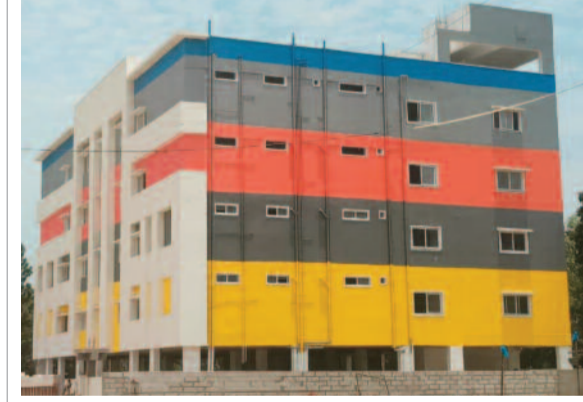
నిర్మాణ దశలో నారాయణ పాఠశాల భవనం