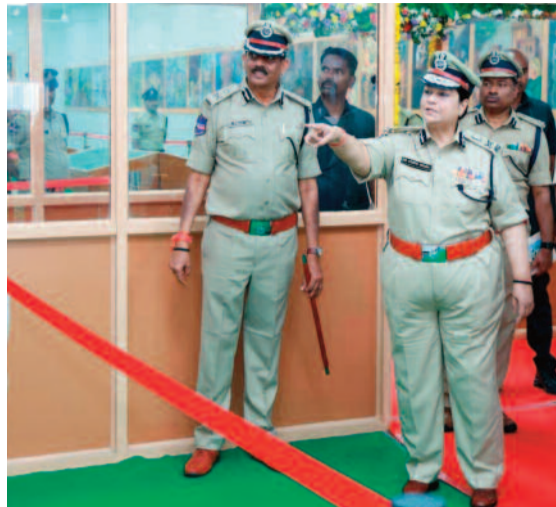
వివరించారు. జైలులో మార్పు తీసుకురావడానికి అవసరమైన అన్ని రకాల చర్యలు తీసుకోవాలని జైలు అధికారులకు గవర్నర్ శివ ప్రతాప్ శుక్లా సూచించారు. మరోసారి తప్పుచేసి అలోచన రాకుండా జైల్లో పరివర్తన తీసుకురావాలని అధికారులకు స్పష్టం చేశారు. సాధారణ ప్రజల కోసం చందల్ గూడ జైలు అధికారులు వినుతూ ప్రయోగానికి

(మొదటిపేజీ తరువాయి) ఈ ముఖ్యమంత్రి ఉన్నది కేవలం ఇతిహాసానికి సంబంధించిన వస్తువులు కాదన్నారు. స్వాతంత్ర్యానికి ముందు జైళ్లలో ఉన్నవారు ఎలాంటి పరిస్థితులు ఎదుర్కొన్నారు? ఈ ముఖ్యమంత్రి ద్వారా తెలుస్తుందని చెప్పారు. శిక్షల పేరుతో సంస్కారాన్ని, శరీరాన్ని, మనస్తత్వాన్ని విరగొట్టే ప్రయత్నం చేశారని బ్రిటిష్ పాలనలో సాగిన అకృత్యాలను ఆయన వివరించారు. మన కోసం మన పూర్వీకులు పడ కష్టాన్ని తెలుసుకునేందుకు ప్రతి ఒక్కరు ప్రయత్నం చేయాలని ప్రజలకు తెలంగాణ గవర్నర్ శివ ప్రతాప్ శుక్లా సూచించారు. విద్యార్థి నాయకుడిగా ఉన్న సమయంలో తాను పలుమార్లు జైలుకు వెళ్లినట్లుగా, ఎమ్మెల్యే+సీని సమయంలో 21 రోజులు తాను జైల్లో ఉన్నానని ఆయన గుర్తు చేసుకున్నారు. అప్పడే జైలు ఎలా ఉంటుందో తనకు తెలిసినది వివరించారు. గతంలో ఉత్తరప్రదేశ్ లో కళ్యాణ్ సింగ్ ప్రభుత్వంలో జైళ్ల శాఖ మంత్రిగా తాను పని చేశానని తెలంగాణ గవర్నర్ గుర్తు చేసుకున్నారు. ఈ సందర్భంగా జైళ్లలో తాను పలు సంస్కరణలు తీసుకొచ్చానని తెలిపారు. ఈ సంస్కరణలతో జైలులను సంతోషం వ్యక్తం చేశారని చెప్పారు. ఈ రోజు ముఖ్యమంత్రి చూసిన దృశ్యాలతో.. మళ్ళీ ఆవారీ జైలుకాలు తనకు గుర్తుకు వచ్చాయన్నారు. జైలులో ప్రతి ఒక్కరూ క్రిమినల్స్ కాదని.. పరిస్థితులు వారిని ఆ సమయంలో నిందితులుగా మార్చాయని