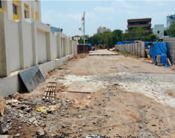
నిర్మాణ దశలో ఉన్న పాఠశాల ప్రాంగణం

సాధారణంగా ఒక పాఠశాల ప్రారంభించాలంటే ప్రభుత్వ నిబంధనల ప్రకారం ముందస్తు అనుమతులు తప్పనిసరి. కానీ, అత్యల్పిలోని నారాయణ స్కూల్ యాజమాన్యం అవేవీ వట్టింతుకోకుండానే అడ్మిషన్లు ప్రారంభించింది. పాఠశాల భవనం ఇంకా నిర్మాణ దశలోనే ఉంది. కనీస వసతులు కూడా లేవు. అయినప్పటికీ ఆడంబరమైన ప్రకటనలతో తల్లిదండ్రులను ఆకర్షిస్తూ భారీగా ఫీజులు గుంజుతోంది.